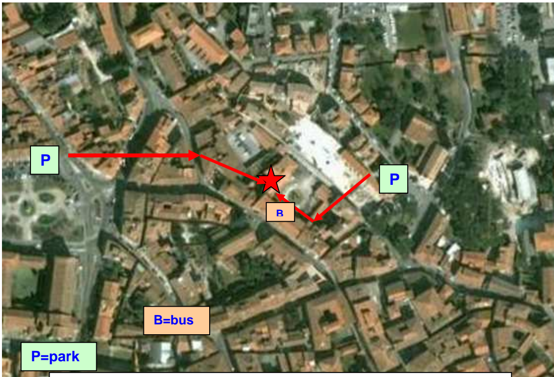
Schema degli accessi